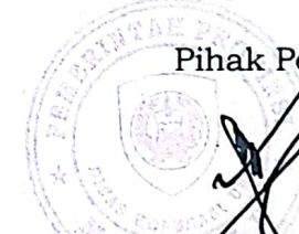
Murad Ismail Gubernur Maluku