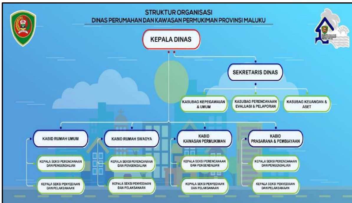
Gambar 1.1. Bagan Struktur Organisasi Dinas PKP Provinsi Maluku

Secara lebih rinci, tugas dan fungsi masing-masing bidang pada Dinas Perumahan dan Kawasan Permukiman Provinsi Maluku dijelaskan dalam tabel berikut: